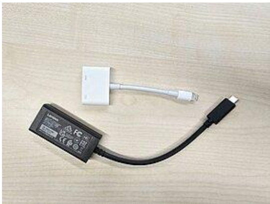
Abbildung 3: Oben der Lightning-, unten der USB-C-Adapter auf HDMI

In vielen Fällen liegt jedoch keine Störung der im Saal verbauten Technik vor, sondern die Ursachen liegen an kleinen, vermeintlichen Helfern, die zu den Terminen mitgebracht werden: Kabeladapter, welche die Signale von diversen Steckertypen der verschiedenen Laptops, Tablets oder sonstigen Endgeräte