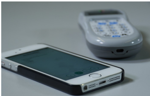
Hardwareclicker und Smartphone

Für das vollumfängliche Nutzen der Software sind Lizenzen nötig, die kostenfrei beim Rechenzentrum angefragt werden können: multimedia@uni-wuerzburg.de