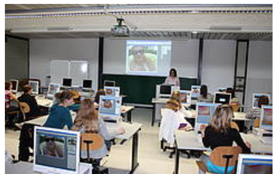
Treffpunkt 1U29 im RZ

Das Rechenzentrum informiert alle Interessenten über seine Dienstleistungen wie Internet, WLAN, PC-Arbeitsplätze, Drucken, Software, IT-Support, Kurse, Schriften und anderes mehr.