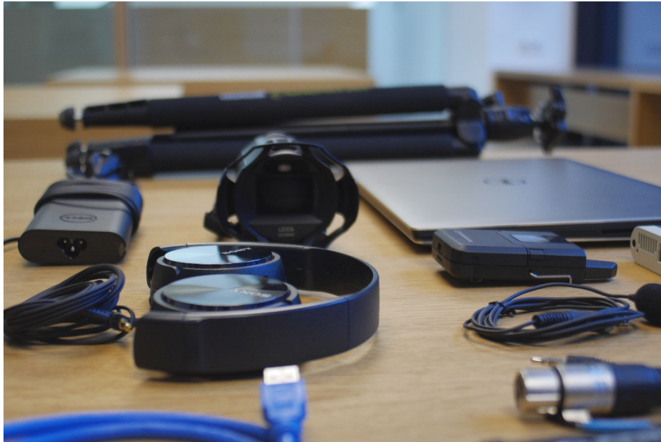
Alles Nötige für den Videodreh

Wenn Sie regelmäßig eigene Lehrvideos produzieren wollen, können Sie das Set gerne auch für ein ganzes Semester entleihen.