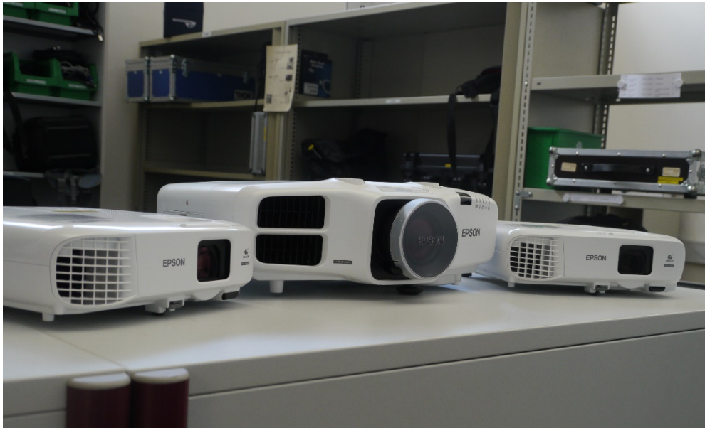
Abbildung 3: Neue Beamer im Geräteverleih

Das Angebot reicht von Videoproduktionssets, Audiorekordern, Beamern, Notebooks bis hin zu Konferenzsystemen und Beschallungsgeräten. Speziell die Sparte „Beamer“ wurde nun mit neuen, lichtstarken Geräten verstärkt.