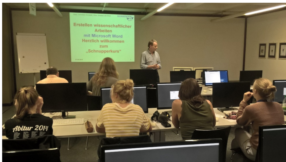
Abbildung 1: "Don't worry with word" beim Akademischen Schreiben kompakt

Am 22.11.2018 von 10 bis 19 Uhr heißt es deshalb wieder in der UB: „ASK II“. Auch dann wird es wieder neben persönlichen Einzelberatungen direkt am RZ-Infostand auch Vorträge unter dem Motto "don't worry with word" geben. Diese erläutern den Studierenden, wie man mithilfe der IT-Kurse des Rechenzentrums eine Seminar-, Master- oder Bachelorarbeit und mehr perfekt zu Papier bringt.