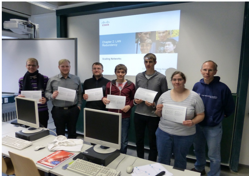
Abbildung 2: Empfang der Zertifikate für die Teilnehmer der Cisco Academy

Der Kurs ist 4-semesterig und richtet sich an Studierende und Mitarbeiter mit Interesse an Netzwerktechnik. Er findet semesterbegleitend im Wintersemester 2018/19 jeweils donnerstags 14.15 bis 18.00 Uhr (Schulung mit Übungen) statt. Die Übungen bestehen überwiegend aus Aufgaben zur Konfiguration von Routern und Switches der Firma Cisco.